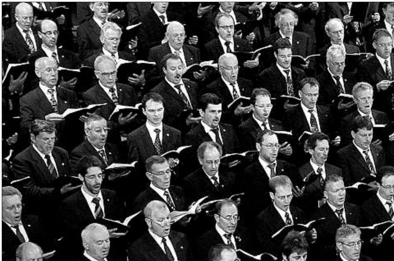
Ils dus chors virils dalla Surselva, la Ligia Grischa ed il Chor da vallada Lumnezia, han concertau per l'emprema gada comunabla.

Il spazi chor dalla baselgia da s. Martin a Cuera – cun l'orgla davostier sco cullisa prest naturala – ei s'emplenius senza