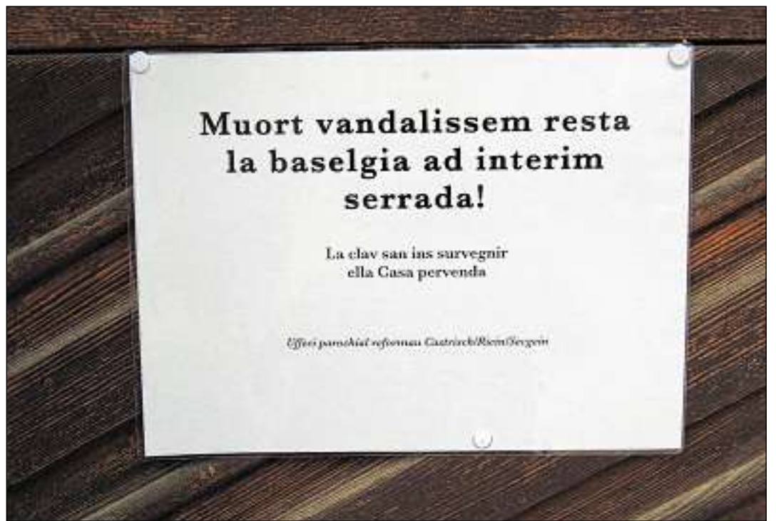
Sch'ei va aschia vinavon penda semeglionts placats forsa prest vid tuttas baselgias. A Castrisch penda quest placat pervia digl enguladetsch da 29 fiffas d'orgla.

■ Puspei in enguladetsch nuncapeivel – ord la baselgia reformada da Castrisch han laders engulau 29 fiffas d'orgla. Ier ei igl enguladetsch vegnius annunziaus alla polizia cantunala che ha ussa da sclerir tgi che ha engulau las fiffas e cu. Tenor Thomas Hobi, il plidader da medias dalla polizia cantunala, ei igl enguladetsch da 29 fiffas d'orgla ord la baselgia reformada da Castrisch vegnius annunziaus ier. Ladinamein seigi la polizia serendida a Castrisch per prender si il cass. Tenor empremas retschercas ei igl enguladetsch vegnius remarcas il 19 d'avrel. Probabla-mein seigien las fiffas era vegnidas enguladas avon cira ina jamma. Ils laders hagian engulau fiffas cun tuns plitost aults ord differents registers. L'orgla da Castrisch datescha dil 1965 ed ei dil construder d'orglas Metzler da Dietikon (avon a Favugn). Sco Thomas Hobi ha saviu dir, han ils laders engulau fiffas en la valeta da rodund 1800 fangs. Sch'ins