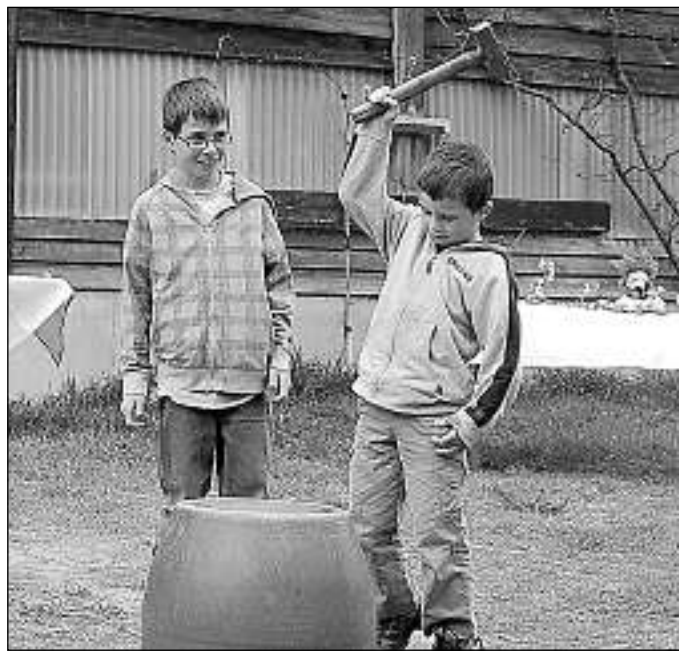
Era la proxima generaziun da brischavinars ha martellau cun tutta forza per sustener ils giavischs pil futur.